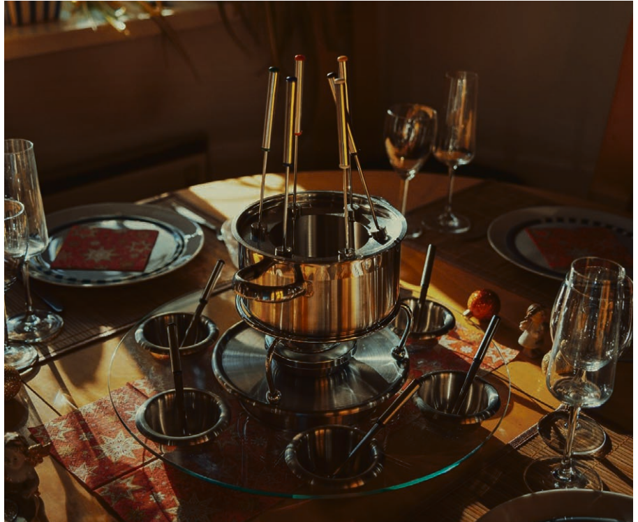
Une fondue vigneronne vous attend le 9 novembre pour le repas de soutien de la maison de paroisse de Vallorbe.

Lors du culte du dimanche 17 novembre prochain, à 10h , au temple, nous prendrons le temps du souvenir de toutes les personnes qui nous ont quittés au cours des derniers mois. Si vous avez perdu un