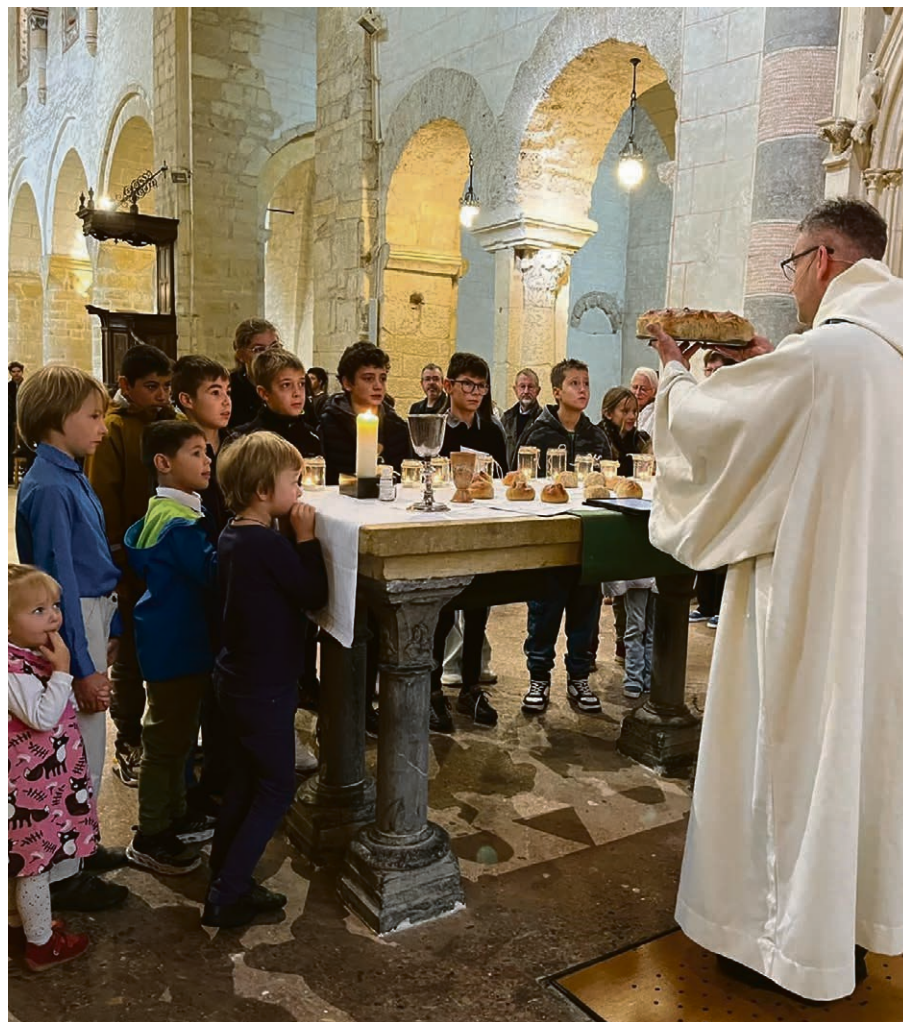
A l'abbatiale de Romainmôtier, le culte d'ouverture des activités paroissiales était intergénérationnel.

Les samedis de l'Avent 30 novembre, 7, 14 et 21 décembre, à 17h , Centre paroissial de Romainmôtier, lectio divina proposée par la FPO sur le texte du dimanche, pour se préparer et intérioriser cette attente du Sauveur. ▲