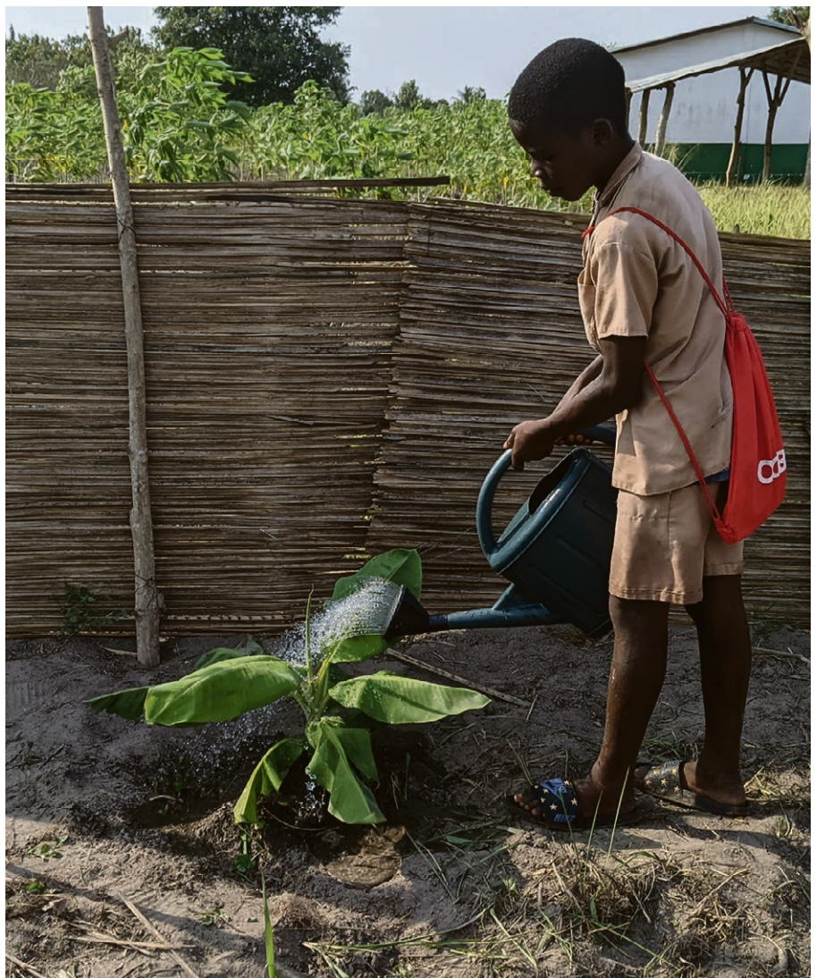
Le Secaar offre un accompagnement socio-économique, environnemental et spirituel des communautés.

Rapidement, les mains se lèvent. Les questions s'enchaînent. En fin de soirée, les échanges entre les communautés ont été réels malgré l'absence de Ghislain. Tout le monde se quitte en méditant ce proverbe « Ce que l'on sème, on le reçoit sous la forme de bonté ». ▲