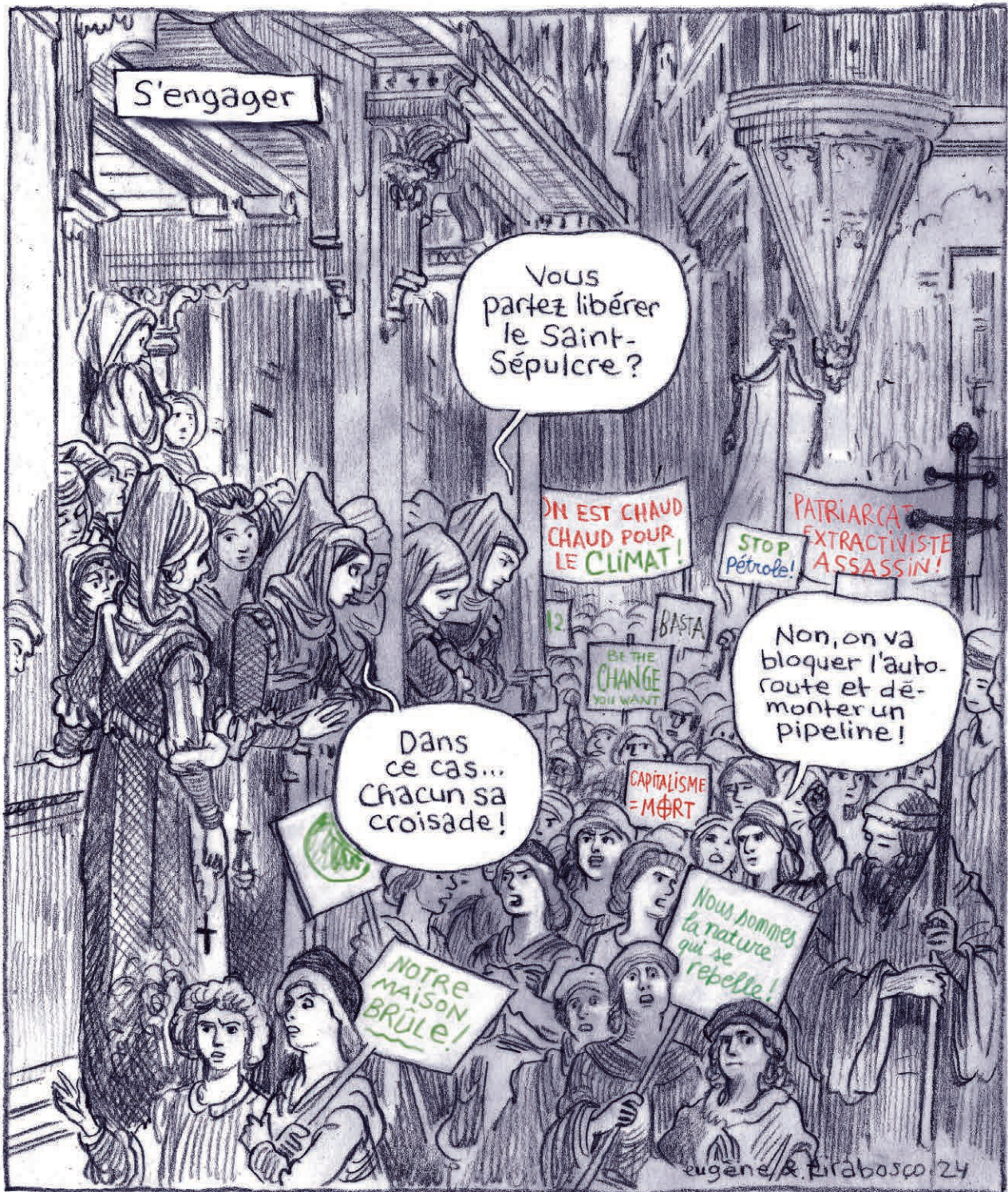
D'après «La Croisade des enfants» de Gustave Doré, 1877