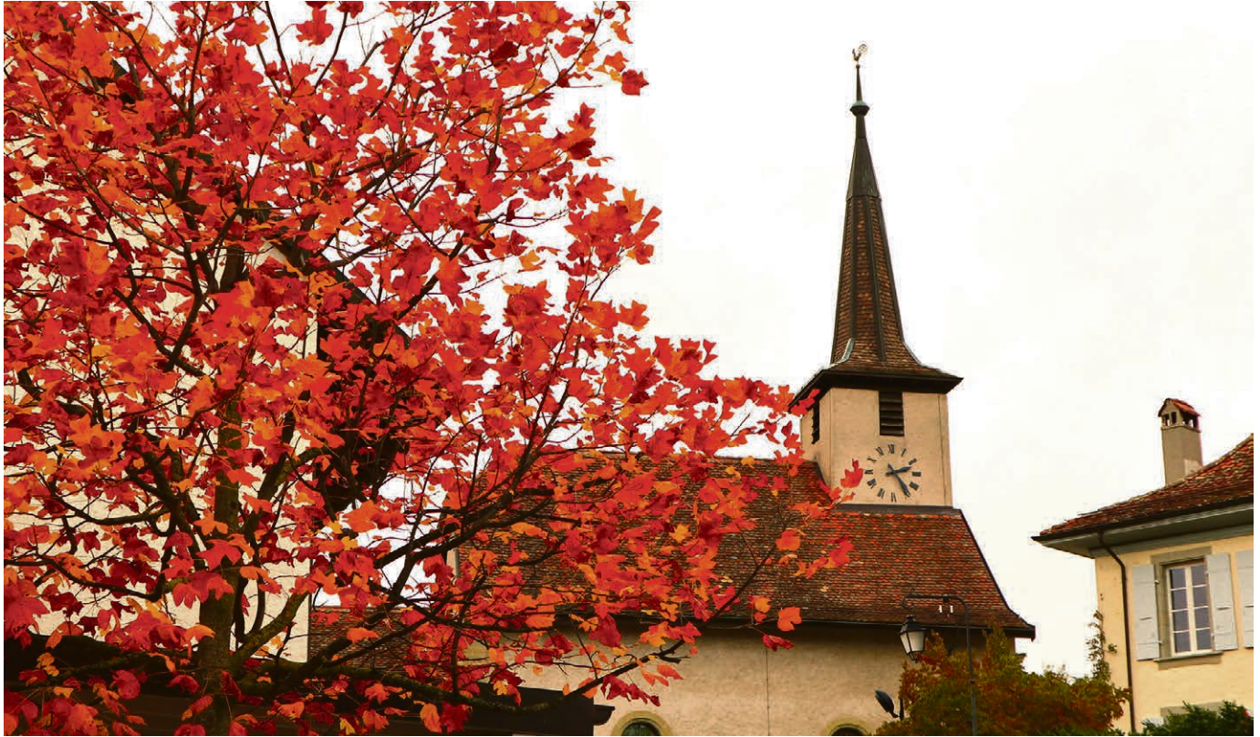
Le temple de Lonay aux couleurs de l'automne.