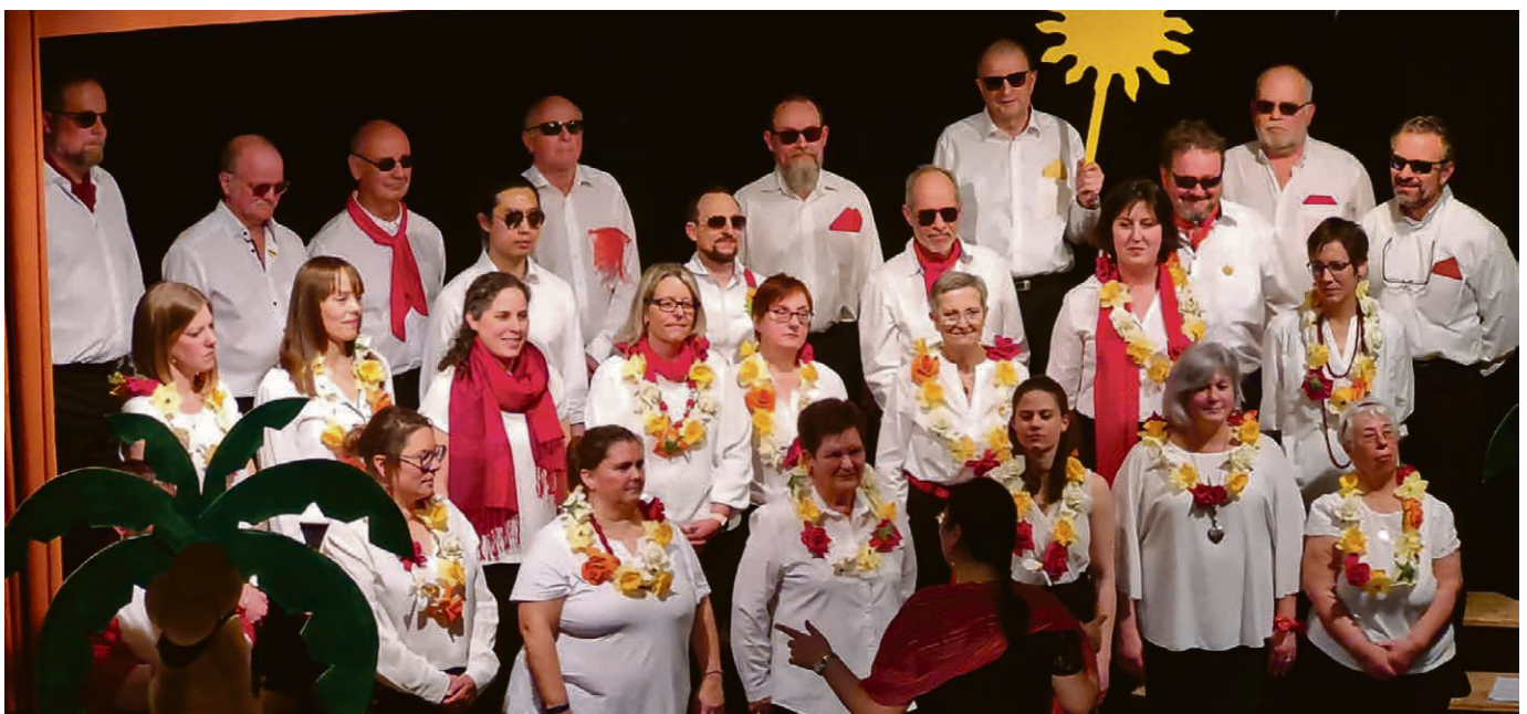
Paroisse de Pied du Jura : Le chœur mixte de Ballens participera à notre fête d'automne du dimanche 3 novembre.

KIRCHGEMEINDE MORGES-LA CÔTE-NYON Sonntag 27. Oktober 10 Uhr, Morges, Kapelle Couvaloup, M. Heutmann. Sonntag 3. November 10 Uhr, Signy ob Nyon, M. Heutmann. Sonntag 10. November 10 Uhr, Morges, Kapelle Couvaloup, Gottesdienst zur Herbstversammlung, M. Heutmann. Sonntag 17. November 10 Uhr, Signy ob Nyon, M. Heutmann. Sonntag 1. Dezember 10 Uhr, Signy ob Nyon, Gottesdienst zum 1. Advent mit Abendmahl, M. Heutmann. ▴