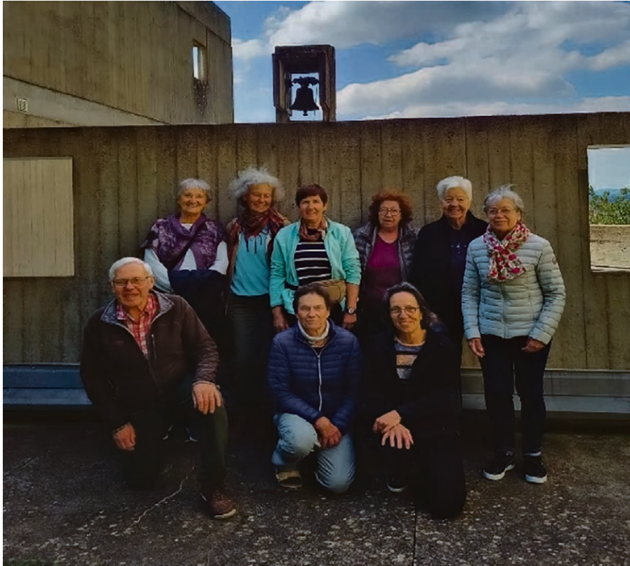
Un beau week-end du Jeûne à Mazille.