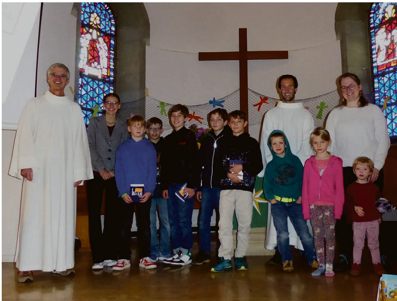
Culte d'ouverture de l'enfance et du catéchisme à Vufflens.