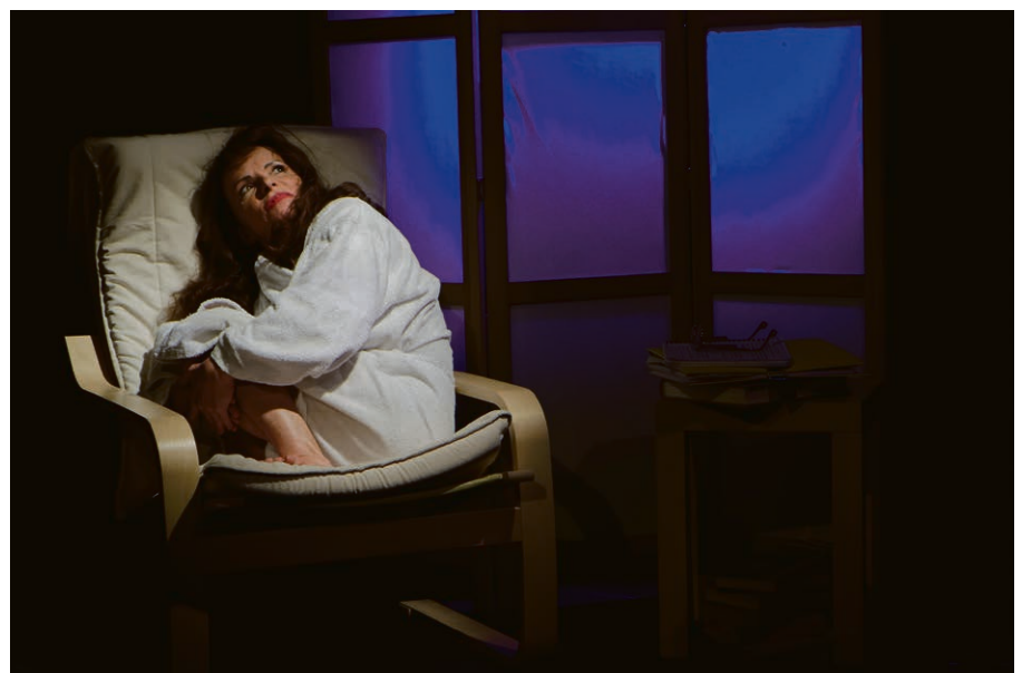
Vendredi 29 novembre, 20h à la salle polyvalente de Préverenges: spectacle « La Vengeance du pardon » par la compagnie de La Marelle. © cie La Marelle