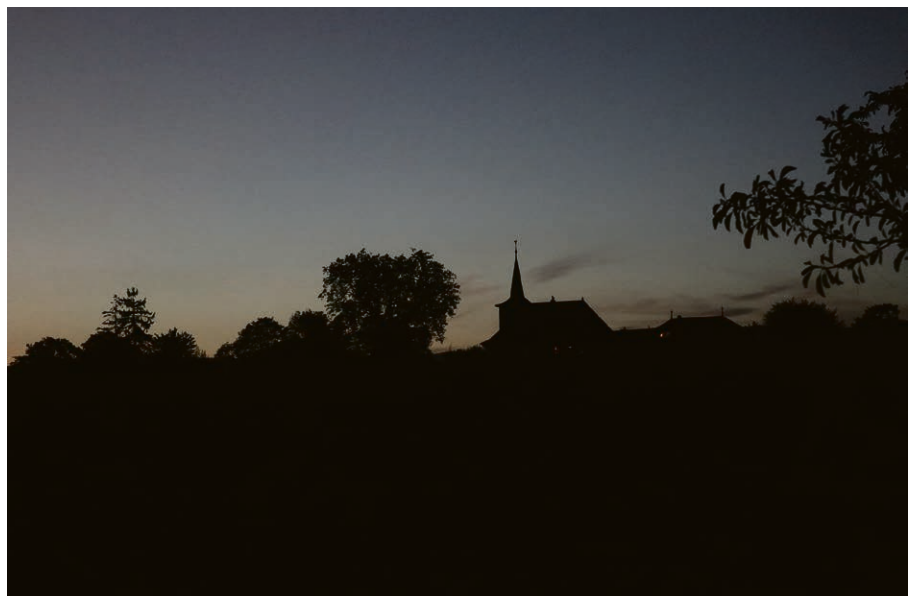
Schatten und Licht.

Wir warten aber auf einen neuen Himmel und eine neue Erde nach seiner Verheissung, in denen Gerechtigkeit wohnt, (2. Petrus 3,13).