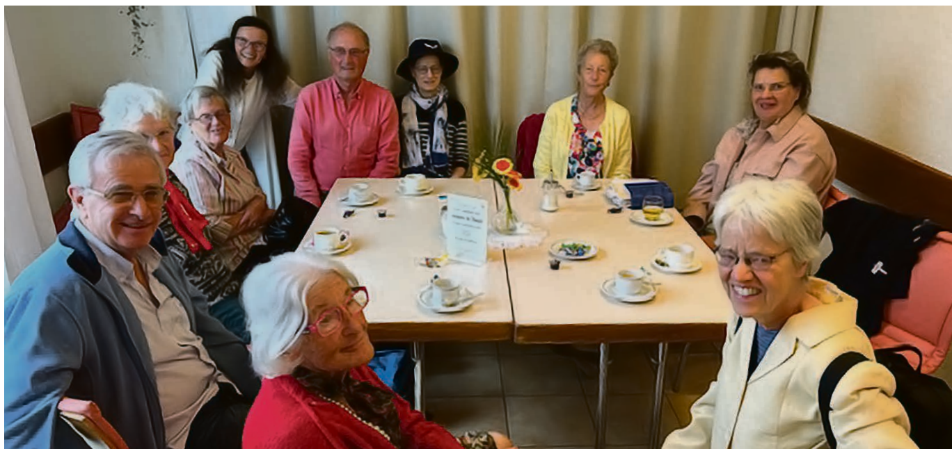
Chaque mercredi, l'Office de Taizé se poursuit par un temps convivial. Une belle façon de renforcer nos liens communautaires. Venez nous rejoindre!