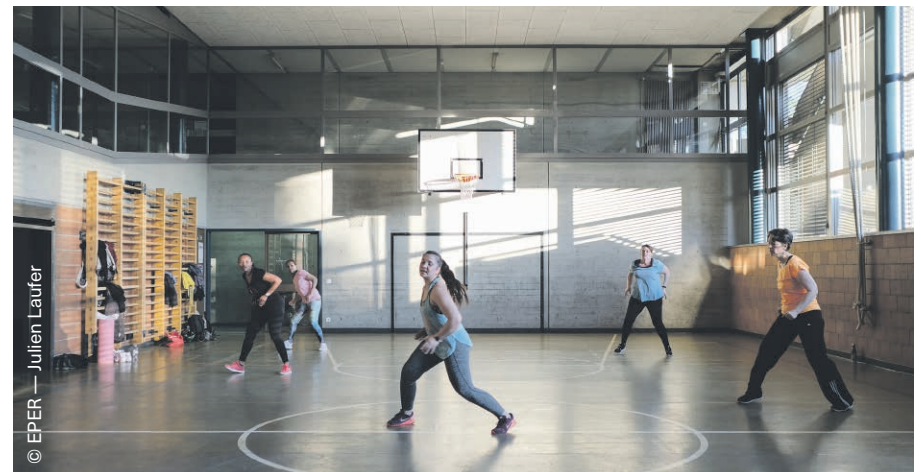
Si beaucoup de clubs sportifs suisses sont orientés vers la compétition, les besoins des migrants en matière sportive tournent d'abord autour de la santé et de la possibilité de tisser des liens.

« On craignait un peu que des ressortissants d'un pays restent entre eux, mais ce n'est pas le cas »