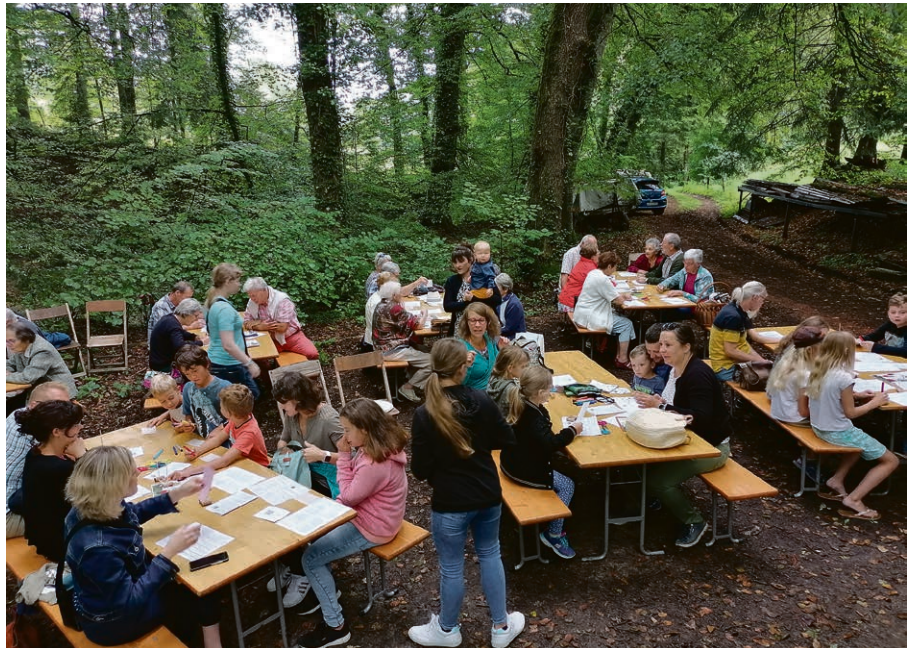
Le Pescadou, entre Rueyres et Pailly : un lieu qui nous rassemblera le 18 août.

Pour allier spiritualité, partage d'un texte biblique, nature et exercice, un samedi matin par mois : 17 août et 21