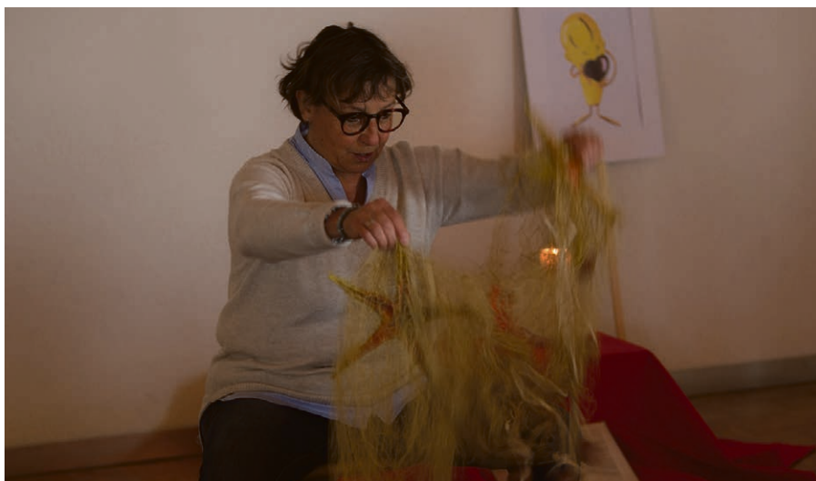
L'histoire biblique par Catherine Novet.