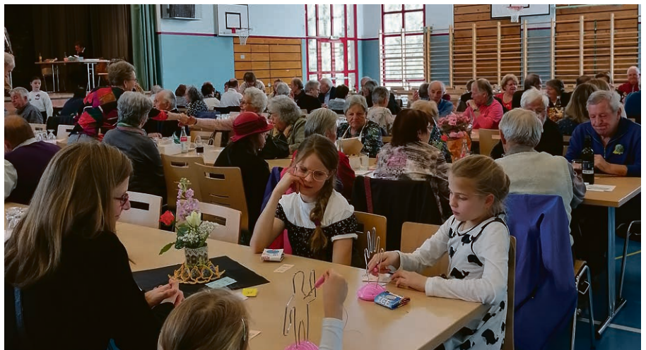
Le Thé-Vente fut un succès, merci à tous.

comme celui des bénévoles qui s'occupent de la mise sous pli et de la distribution.