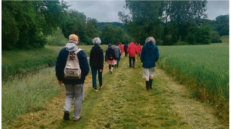
En route pour méditer cet été!

Les prochaines marches auront lieu les jeudis 27 juin – 25 juillet – 29 août . Pour