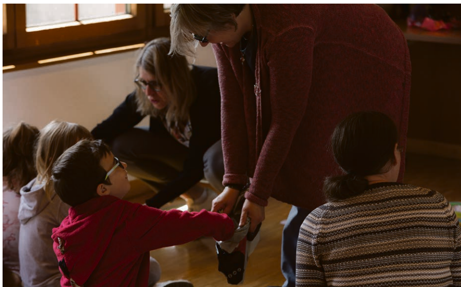
L'atelier du toucher.