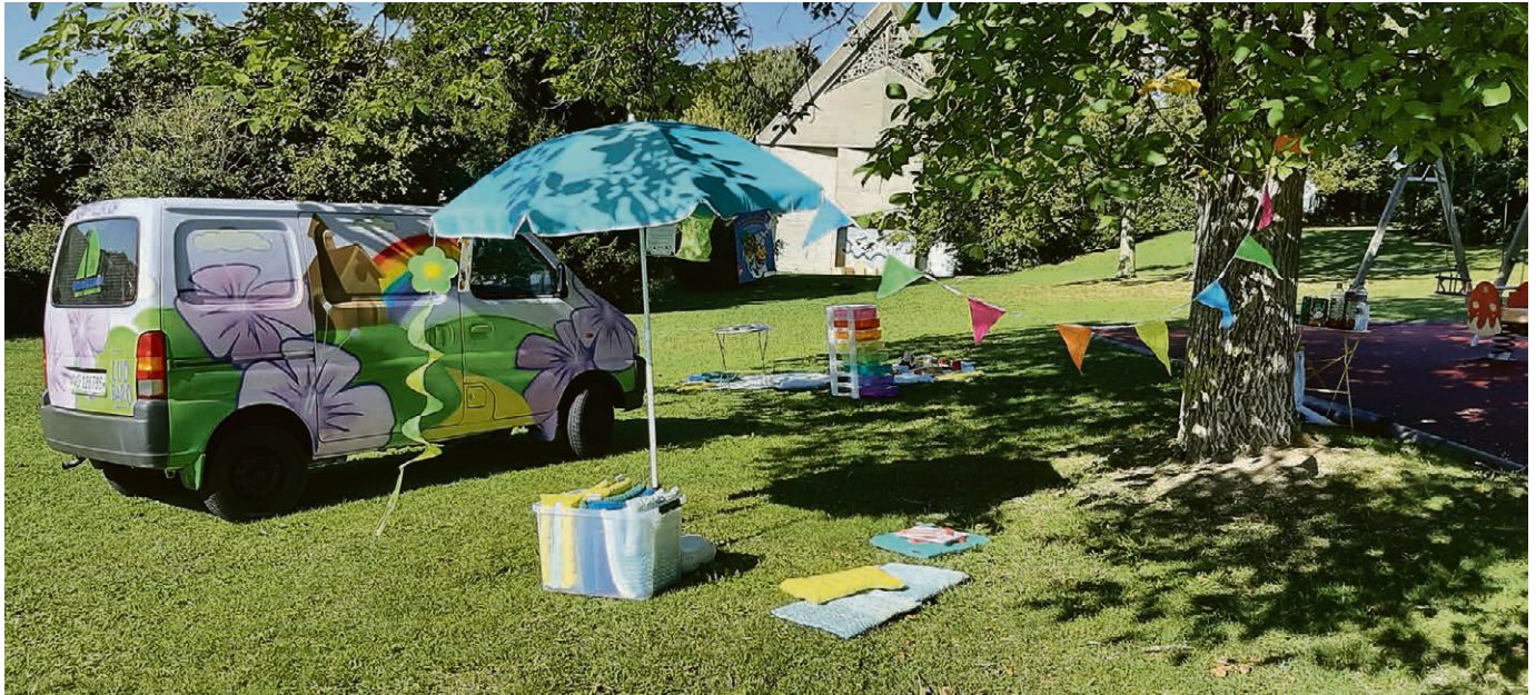
Arc-en-Scène sera sur les places de jeux avec son bus.

Une façon de se relier à nouveau à soi-même, aux autres et au Tout-Autre.