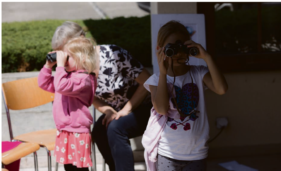
L'atelier de la vue.

Les enfants des trois paroisses se sont retrouvés à Senarclens pour une belle fête qui achevait notre parcours sur les sens. Célébration, ateliers découvertes et repas ont composé le menu d'une belle journée!