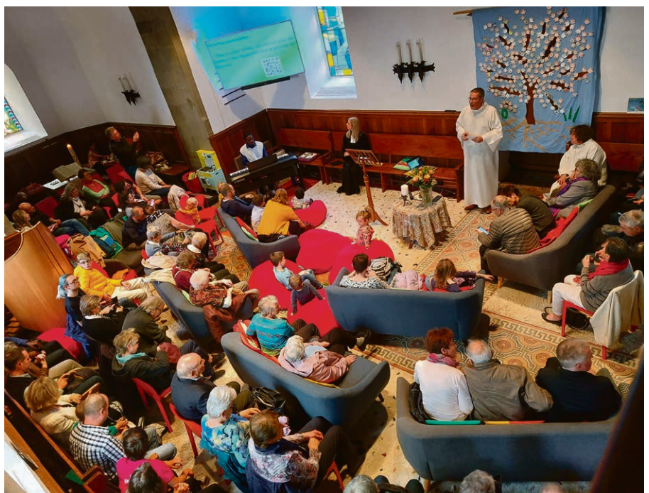
L'église de Bercher bien remplie pour ses 300 ans.