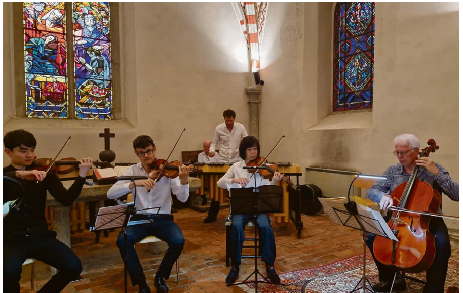
Le concert de musique classique a attiré beaucoup de mélomanes.

Pour rendre visible notre témoignage, nous comptons sur vous tous. Vous avez trouvé ou trouverez dans votre boîte aux lettres un appel financier, merci d'avance de votre soutien toujours apprécié tout