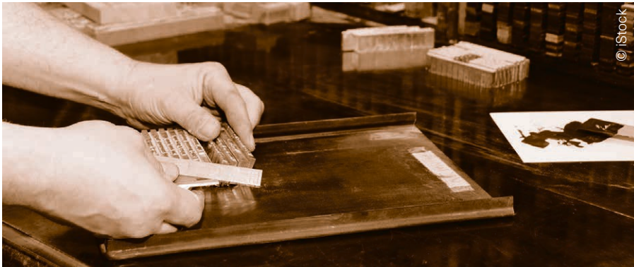
La Linotype permettant la saisie au clavier et la fabrication de lignes de caractères en plomb a révolutionné l'imprimerie de la fin du XIX e siècle. Elle a été utilisée jusqu'à la fin des années 1970.

PATRIMOINE « Les paroles s'envolent, les écrits restent », promettait Horace, mais le poète latin ne connaissait pas les périodiques : journaux et magazines qui après lecture finissent bien souvent comme réceptacle des épiluchures en cuisine, une fois que la date inscrite en une est dépassée. Heureusement, depuis 2012, la