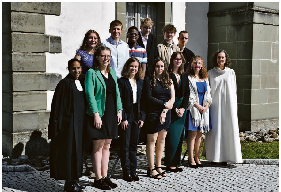
La fête fut belle.