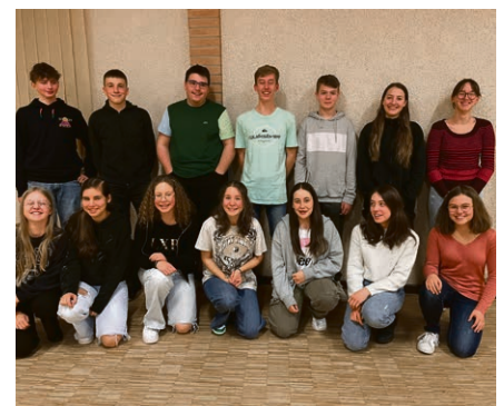
« Va, vis, deviens », souvenir du week-end organisé pour les jeunes de 11°.