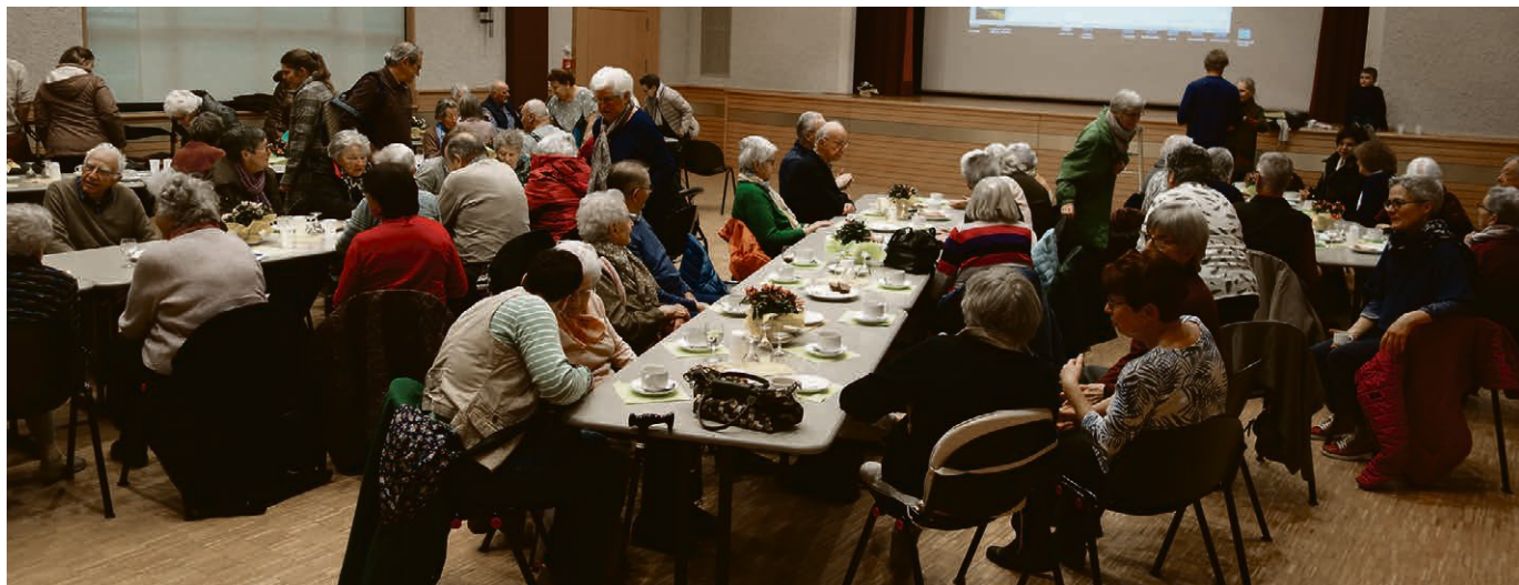
Après-midi des aînés 2024 sur le thème du voyage.

Une particularité de l'héritage : la réunion de personnes appartenant aux paroisses protestante et catholique, tant sur le plan des bénévoles que des participants, quel privilège ! Avec un grand merci aux amis cités, pour le partage de leurs souvenirs. ► Propos de Christiane Besson recueillis par Dina Rajohns