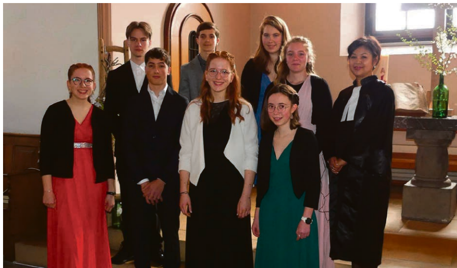
Les jeunes au culte des Rameaux 2024.

Merci pour votre présence aux soupes de carême, à l'après-midi œcuménique des aînés ainsi qu'à la vente des roses. Les sommes récoltées ont été généreuses et ont été attribuées aux projets proposés.