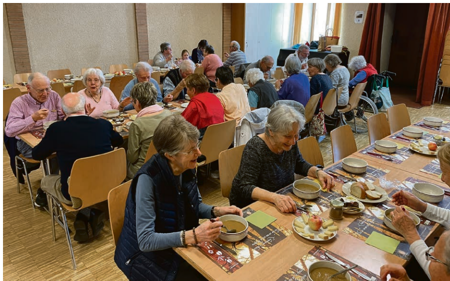
Soupe de carême avec le groupe des aînés au Poyet.

Le 20 mars, le groupe des aînés a dégusté une excellente soupe de carême. Le 24 mars à Curtilles, le culte des Rameaux a été célébré avec les confirmands.