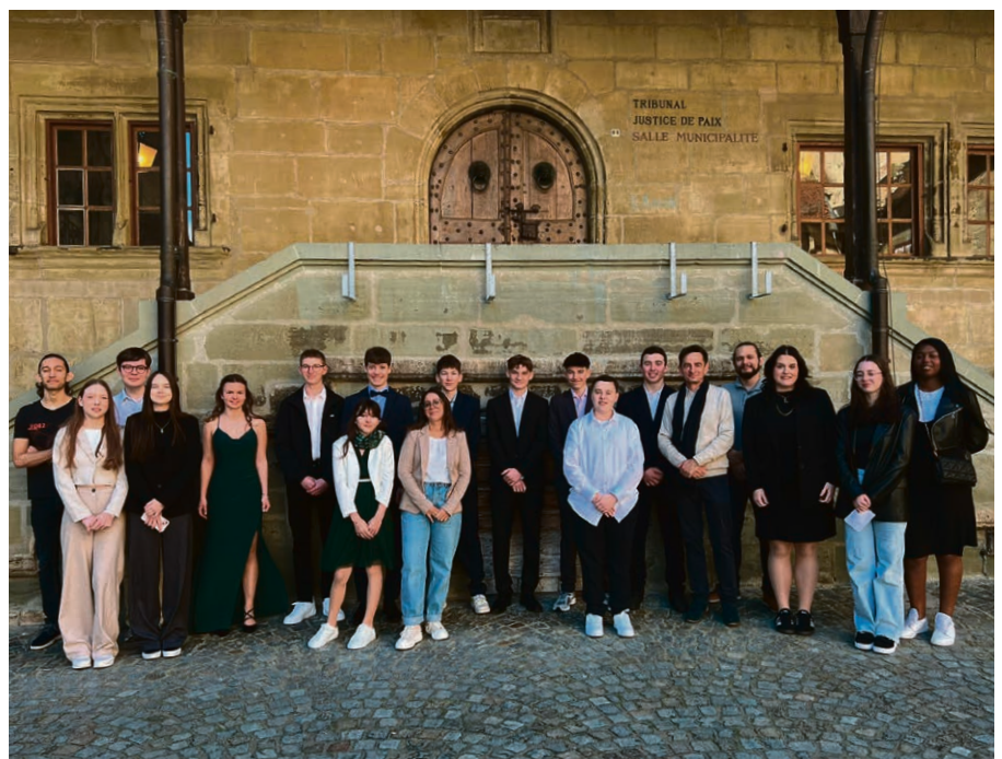
Les huit confirmands de PACORE et leurs accompagnants.