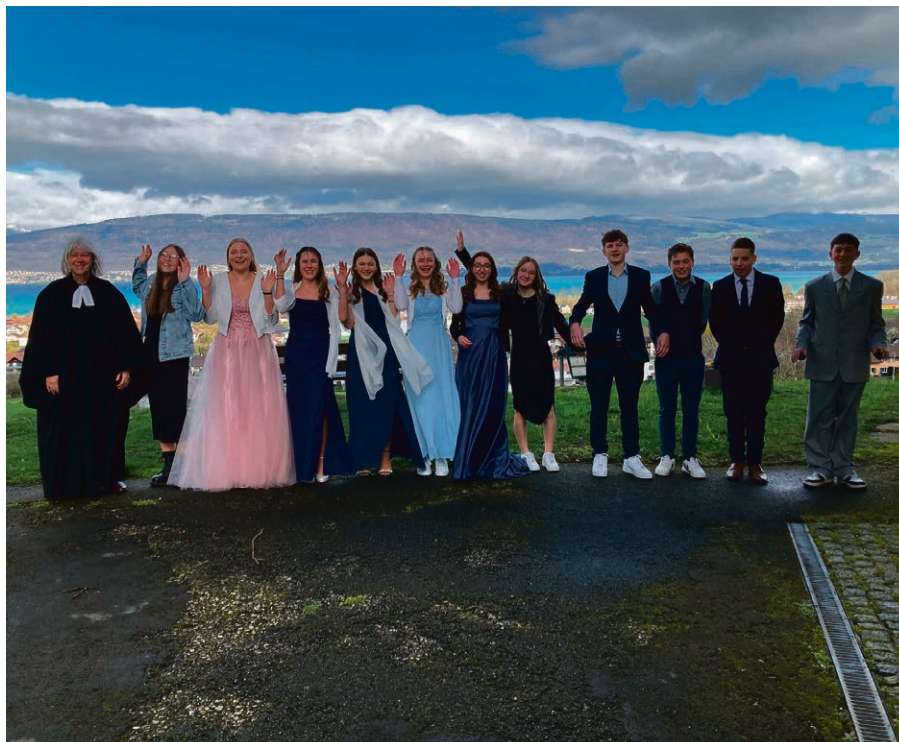
Onze jeunes joyeux ont confirmé à Montet.

Dimanche 26 mai, à 10h , à Montet. Culte des familles sous forme de rallye ! Dans le cadre de « Suisse bouge », nous vivons un culte qui nous mettra en mouvement, avec des postes pour les petits et les grands. Les mouvements de la paroisse seront comptabilisés pour la commune de Montet-Cudrefin.