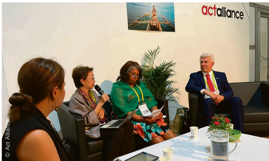
Débat sur le stand d'Act Alliance, à l'assemblée du COE, en septembre 2022.

Une discussion brûlante a eu lieu en marge de l'assemblée du COE à Karlsruhe, dans le « festival off », sur le stand d'Act Alliance, faitière regroupant 137 Eglises et organisations chrétiennes actives dans l'humanitaire, dont l'EPER.