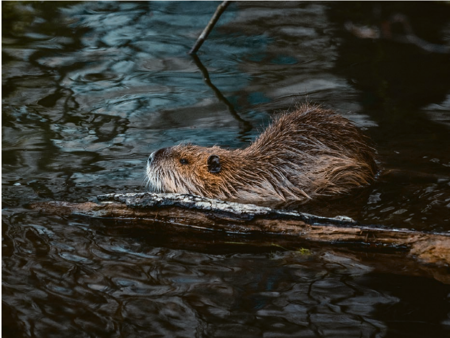
Le castor, un animal protégé dans le canton de Vaud.