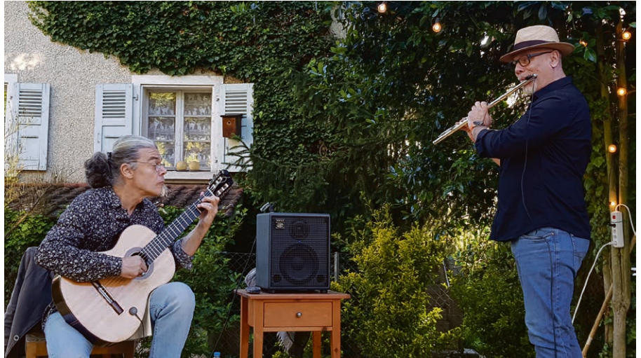
Le duo « & » © Thierry Délitroz.

Désormais, de façon systématique (sauf exception pour les cultes à 9h et sans étoile, voir sur la table à la page « Cultes et prières »), un coin enfant est aménagé au-devant de l'église. Une collation est également prévue pour les enfants pendant la prédication. Pour les familles, il