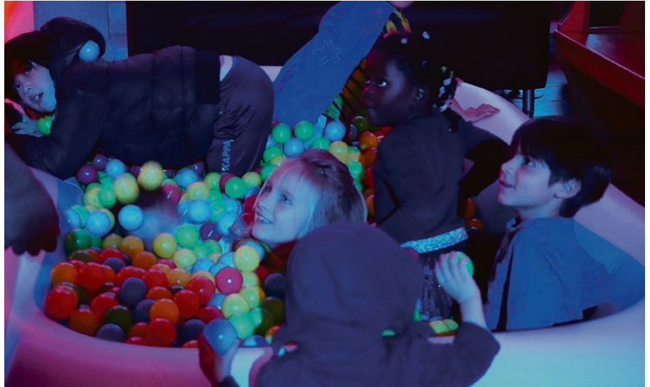
AllôVie, vivre une soirée et habiter l'église autrement.

Godly Play est une activité inspirée de la pédagogie montessorienne, pour les enfants entre 5 et 12 ans. C'est une approche visuelle, tactile et créative des récits bibliques pour encourager les participant-es à s'ouvrir à leur propre dimension spirituelle. Chaque rencontre dure une heure et se compose d'une narration suivie de questions d'émerveillement, d'activités créatrices et d'un « festin » ! Inscriptions flexibles, à une ou plusieurs séances. Les rencontres sont ouvertes à toutes les familles, sans prérequis. Elles peuvent être à la fois une découverte de la spiritualité et des récits bibliques ou un complément de