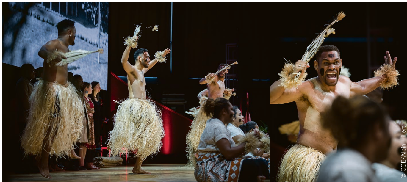
Danseurs d'une communauté du Pacifique. L'art, parce qu'il est vecteur de messages et de valeurs, peut aussi être un outil de mobilisation écologique.