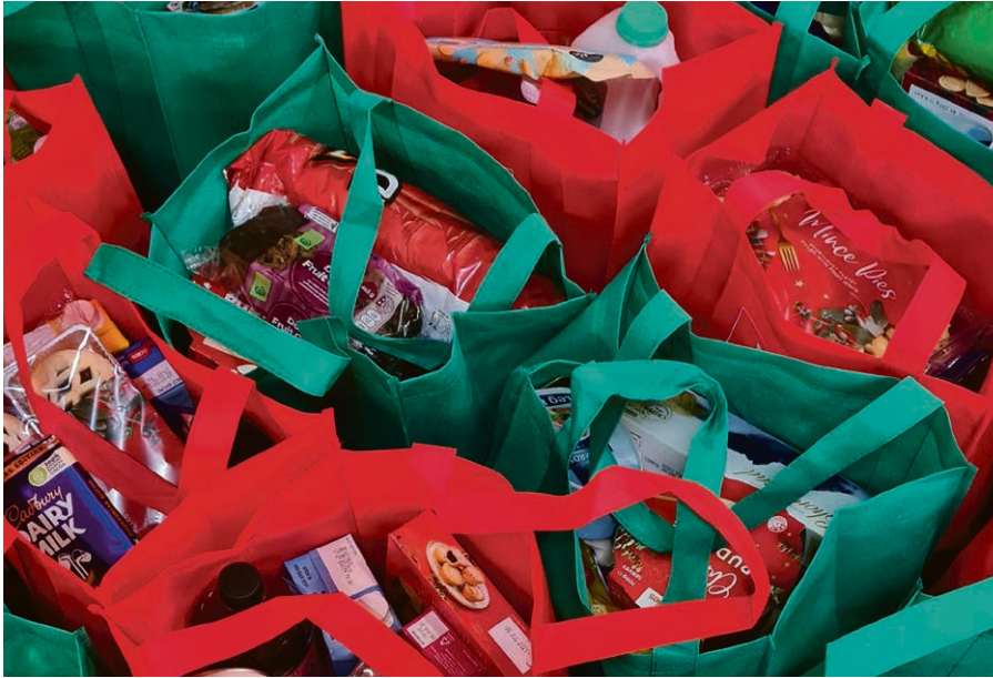
Faire don de denrées alimentaires pour ceux qui en ont besoin.