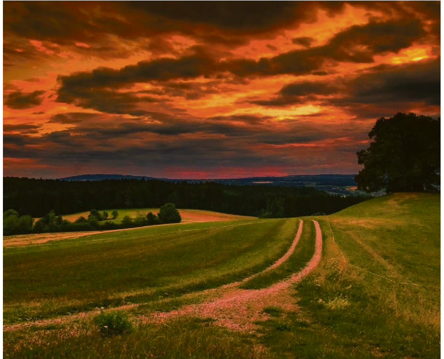
Suivre le soleil qui décline à l'horizon, vers une destination inattendue.

A l'heure du souper, la lumière n'est plus que celle d'une ou deux chandelles. Quand le pain est rompu, leurs yeux aveugles voient « la » lumière, une frac-