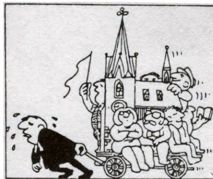
Non, ce n'est pas le jeu des sept différences !

Le bonheur de mon ministère a été dans toutes les collaborations enrichissantes, développées au sein des différents groupes