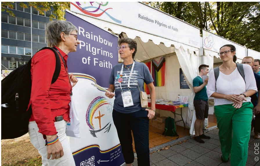
Le stand du pèlerinage arc-en-ciel a accueilli de nombreuses conversations sur l'inclusivité des Eglises.

S'il y a bien un point sur lequel la discussion œcuménique bute, ce sont les diverses sexualités humaines. Conscient de l'écart entre ses membres, le COE a élaboré un outil pour traiter ces questions.