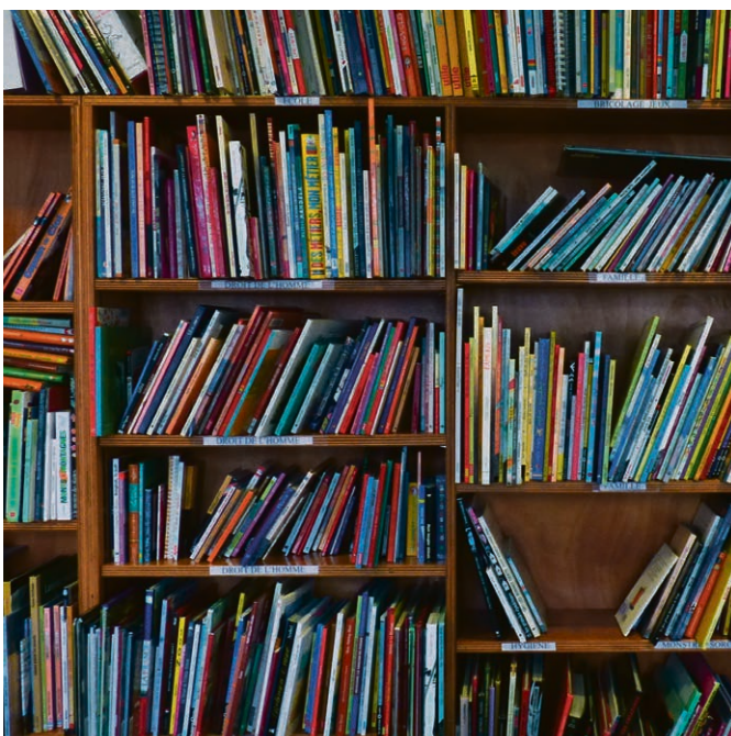
«Viens avec moi, Seigneur». Extrait de «Rentrée», Charles Singer, Société luthérienne, Editions Olivétan.

Ça peut changer concrètement ma vie aujourd'hui.