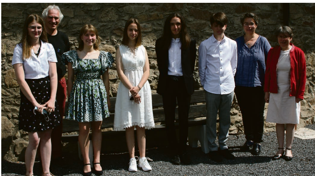
Culte de fin de catéchisme.