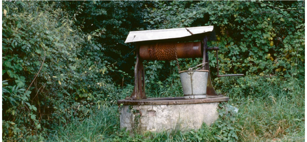
Viens t'asseoir au bord du puits.

LA TOUR-DE-PEILZ A l'heure de la rédaction de la page paroissiale, il est délicat de projeter un agenda des activités en raison de la situation et des mesures sanitaires. Dès lors, nous vous invitons à consulter le site https://la-tourdepeilz.eerv.ch , et la vitrine paroissiale sous le passage du temple régulièrement mis à jour pour vous informer de l'actualité en paroisse. Nous sommes reconnaissants s'il vous est possible de la transmettre aux personnes intéressées qui n'y ont pas accès.