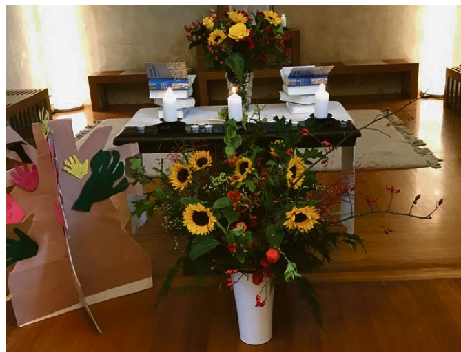
Culte ouverture.

Si vous n'avez pas reçu la documentation, merci de faire signe au secrétariat, paroisse.chj@eerv.ch.