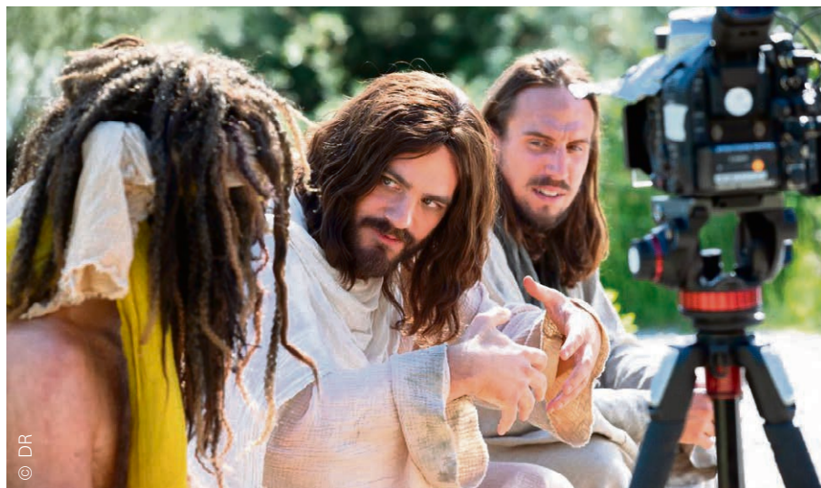
Dans la série, Vincent Veillon incarne J.C. en proie à l'incertitude.

« Des invités de marque rythmeront les épisodes »