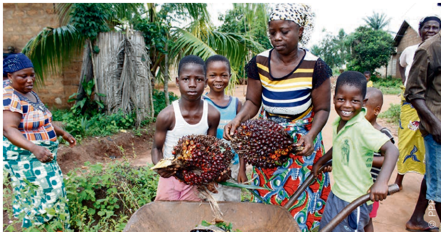
Une famille de cultivateurs en pleine récolte au Bénin.

De grandes entreprises ou des caciques locaux s'approprient les terres de paysan·ne·s. Une situation qui n'est pas prête de s'améliorer.