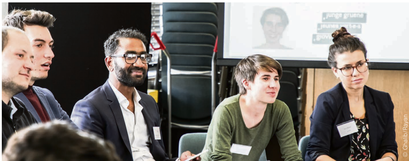
Rencontre entre des organisations de jeunes musulmans et les représentants de jeunes des partis à Bienne en 2019.

Depuis deux décennies, l'islam est associé à des polémiques récurrentes en Suisse. Une conflictualité qui engendre ses propres blocages, complexifiant le rôle des communautés musulmanes sur le terrain.