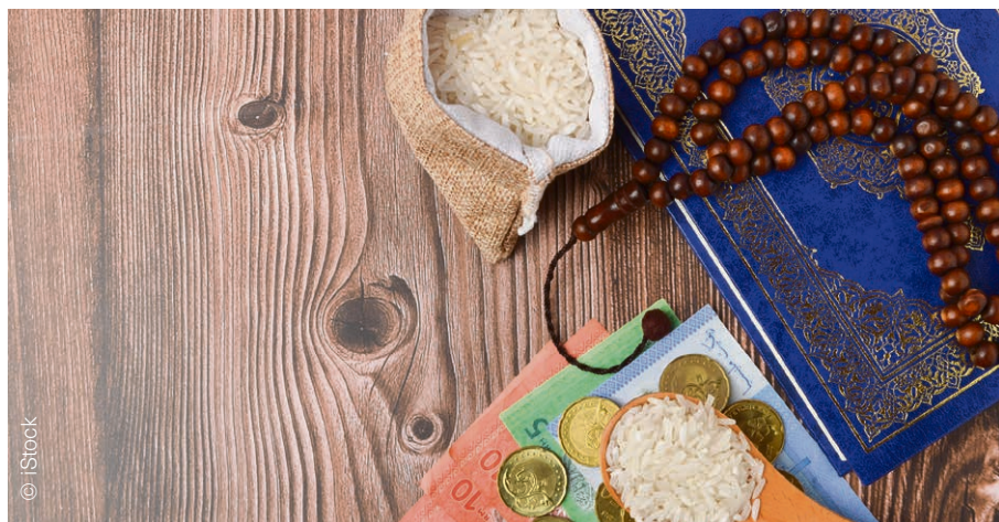
Pilier de l'islam, la Zakat est un don annuel qui peut prendre plusieurs formes.