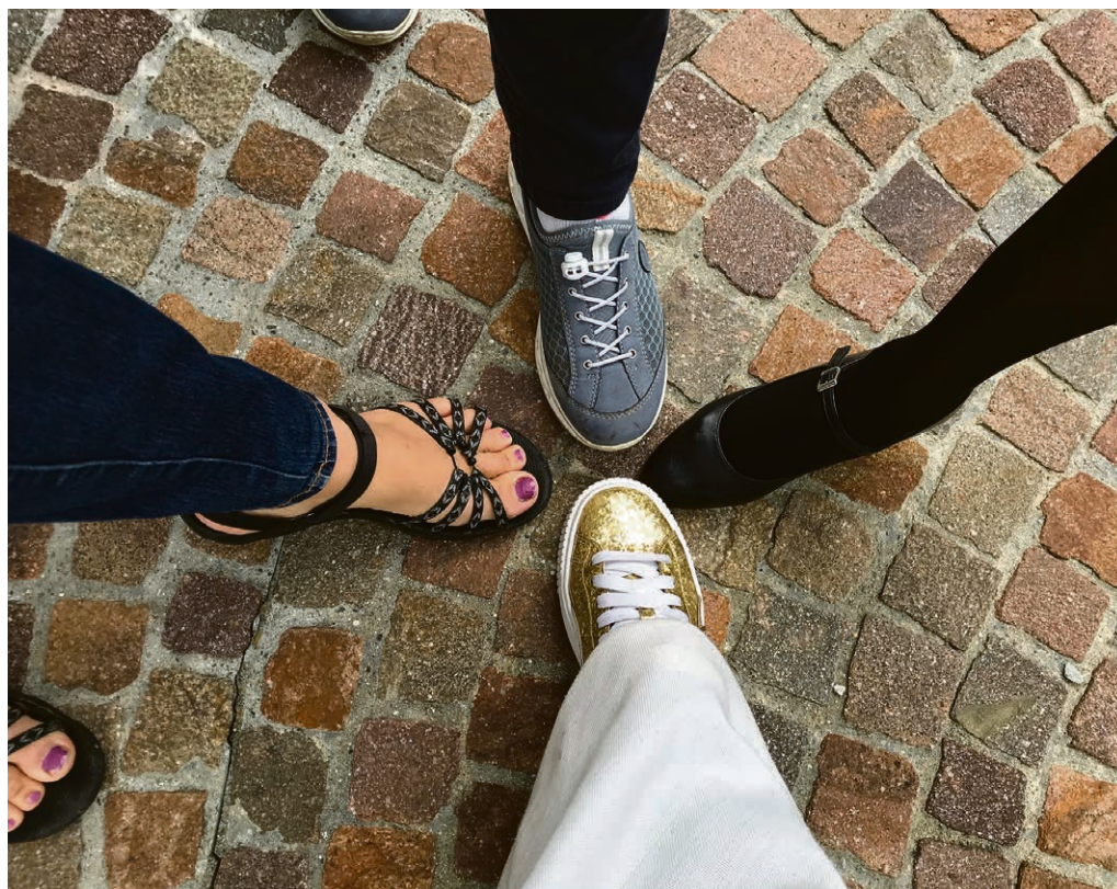
Un pas après l'autre.

Dimanche 3 octobre, à 10h , au temple de Chardonne. Rendez-vous pour le culte d'ouverture des catéchismes et du Culte de l'enfance. Nous nous réjouissons de démarrer une nouvelle année de cheminement spirituel et