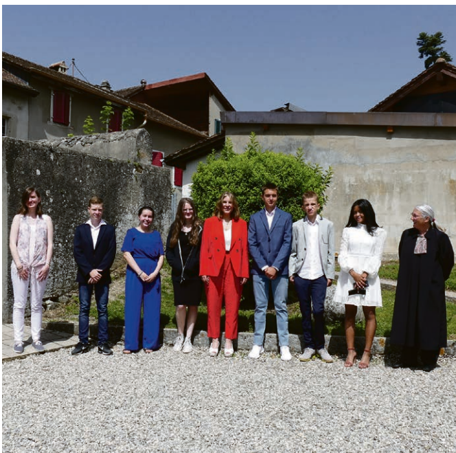
Confirmations à Begnins.

Les paroissien-ne-s offrent des cabas de nourriture, ou des repas cuisinés aux personnes dans le besoin. Il est aussi possible de sponsoriser l'action en achetant un cabas réutilisable. Contactez Françoise Ramel en cas de besoin (022 369 22 54, discrétion assurée).