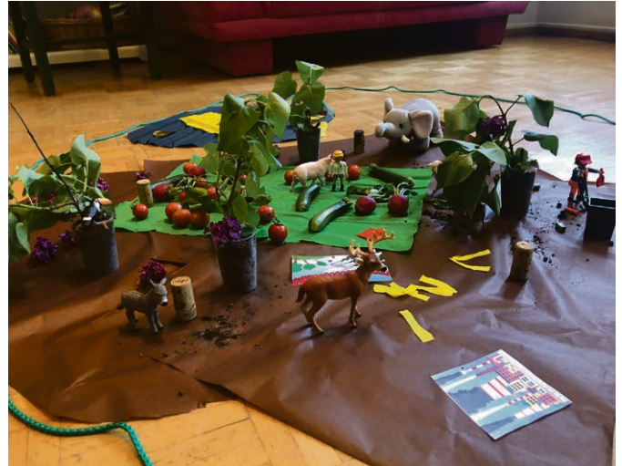
Maquette de Génèse 1 et 2 par les enfants.

de Bonmont, soit le culte paroissial à 10h15 à Bursins.