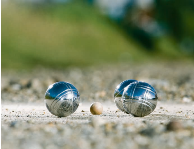
Quel plaisir de se revoir au boulodrome!