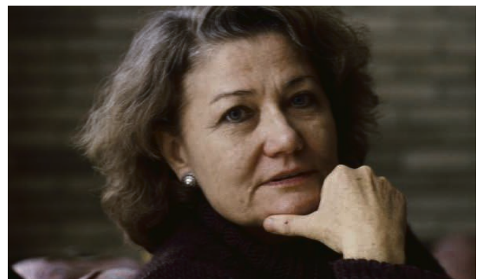
Quatre conférences de Lytta Basset sur la perte et le deuil.

KIRCHGEMEINDE MORGES - LA CÔTE - NYON Ab September: Deutschsprachige Predigten um 10 Uhr 15 in Morges, Kapelle Couvaloup. Wir passen uns der veränderten Zeit des Temple an, um weiterhin unter Glockengeläut zur Kapelle zu gehen.