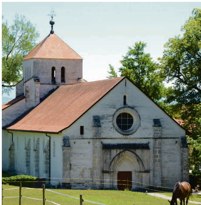
Venez célébrer le Jeûne fédéral à l'abbaye de Bonmont.