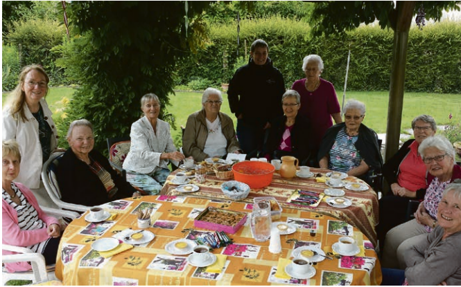
Gesprächskreis: Schön, einander wiederzusehen!

sen! Wer hat, bringe sein Halbtaxabo mit!