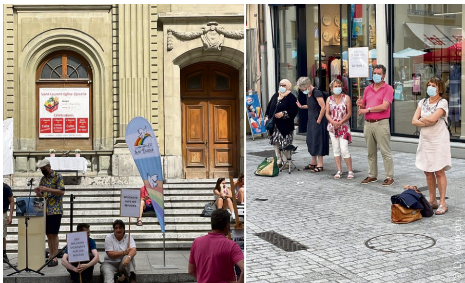
Unis dans la prière. Le 19 juin dernier, à Lausanne, célébration interreligieuse pour les personnes de toutes les religions décédées sur le chemin de l'exil.