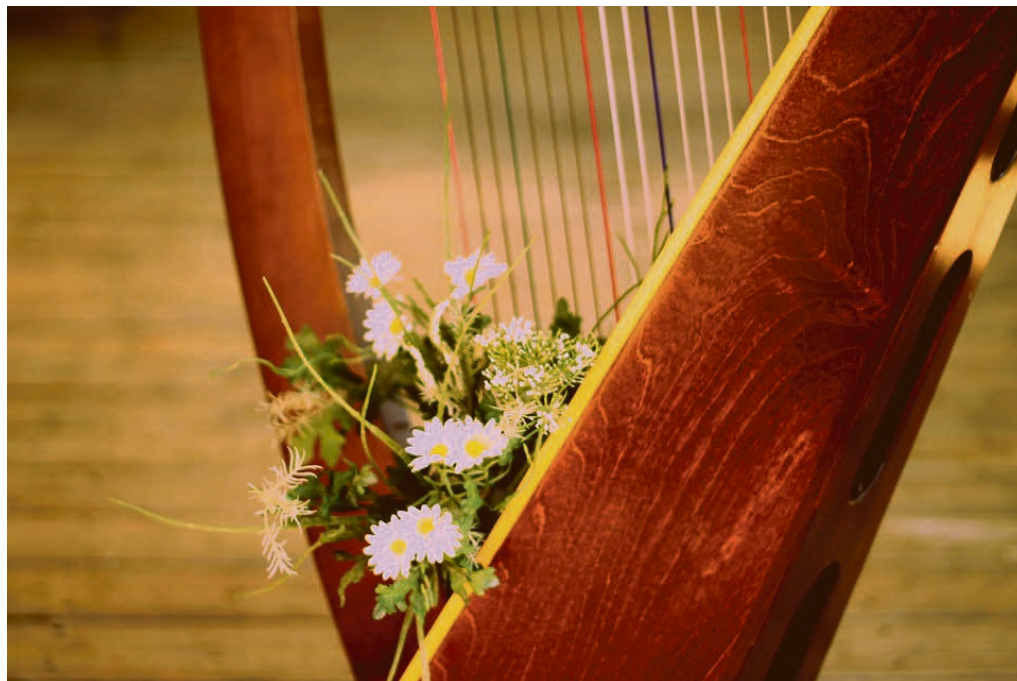
David joue pour Saül.

Les rencontres auront lieu les jeudis 2, 9 et 16 septembre, de 15h30 à 16h15 , à la salle de paroisse de Saint-Cergue, et de 16h30 à 17h15 , à la salle du collège du Muids.