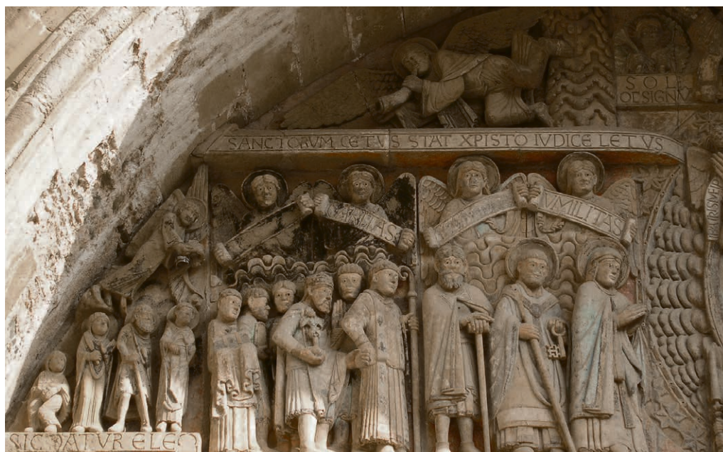
Aile gauche du tympan de l'église de Conques, en Aveyron. France. « Ils marchent ensemble et vont traverser cette nuée qui leur voile l'horizon. »