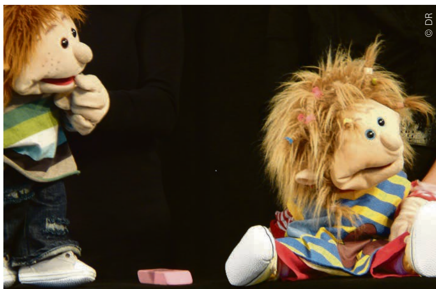
Les Théopoppettes l'une des nouvelles formes ecclésiales de l'EPG.

La cohérence et les objectifs des formes ecclésiales naissantes sont donc régulièrement évalués. Les textes prévoient même qu'un projet puisse être abandonné. « Dans la pratique, nous n'avons pas encore cette expérience. En fait, on se rend compte que les projets ont plutôt tendance à évoluer au fil du temps pour répondre aux besoins de ceux à qui ils s'adressent », note Blaise Menu. « Mais il est clair que l'objectif n'est pas de créer des activités qui doivent être obligatoirement pensées pour durer cinquante ans, la société évolue et certaines activités peuvent perdre leur sens, tout simplement. » Joël Burri