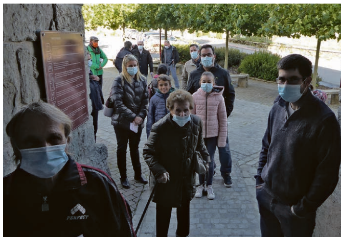
Fête de paroisse, on fait la queue pour entrer au culte !