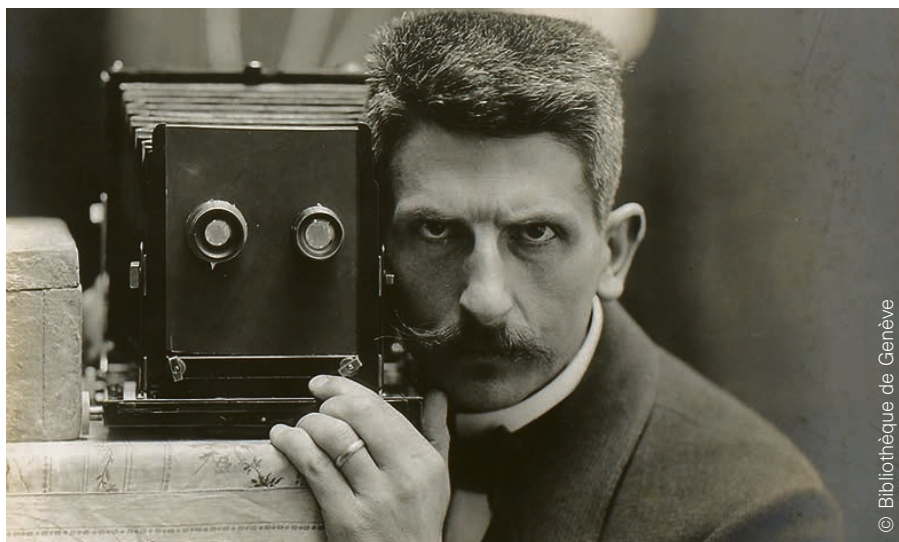
Autoportrait à l'appareil binoculaire, Fred Boissonnas, 1900.

« Après la Grèce, Fred Boissonnas cherchera d'autres voies pour repartir en Méditerranée, raconte l'historienne. Il était fasciné par des projets qui permettaient de restituer un paysage à une histoire. » Ainsi part-il sur les traces d'Homère. Il photographie les différents lieux qui auraient inspiré le récit des péripéties