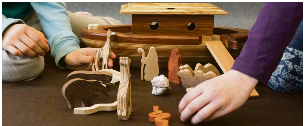
3 décembre: soirée d'information Godly Play® à Payerne.