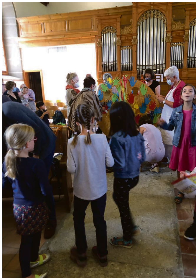
Autour de l'arbre à mains.

Vendredi 13 novembre, à 16h30, à la salle paroissiale.