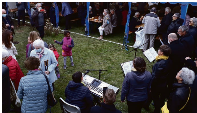
Fête de paroisse : avec les Sunday Gospel Singers.

Dans le silence de la Terre Dimanche 6 décembre, à 17h , chapelle de Ropraz. Il y