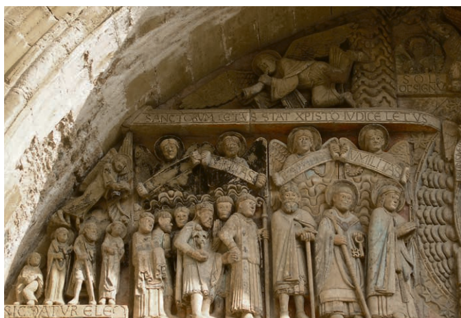
Aile gauche du tympan de l'église de Conques, en Aveyron. France. « Un pas après l'autre, ils traversent le nuage opaque, ils voient plus loin... un nouvel horizon. »

Pour tous renseignements : Michel Noverraz, 078 352 65 61, michel.noverraz@eerv.ch.