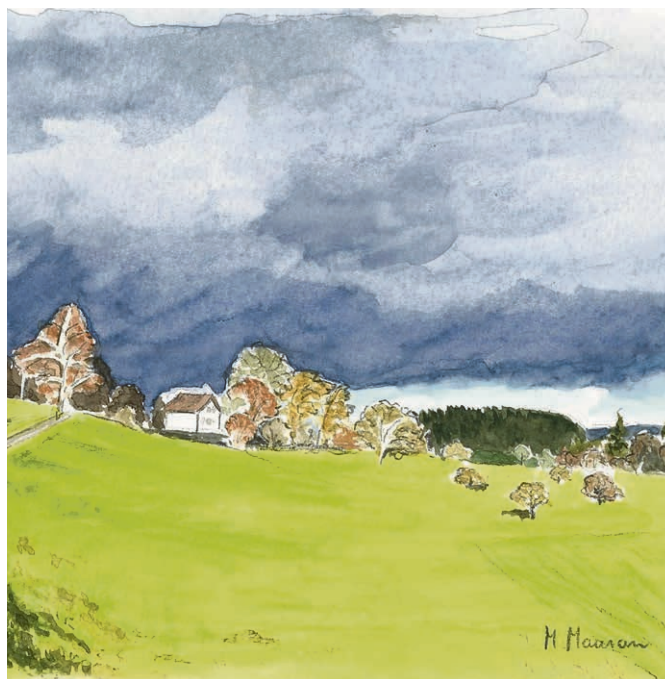
Jeux de lumière en Fremont, Moudon.