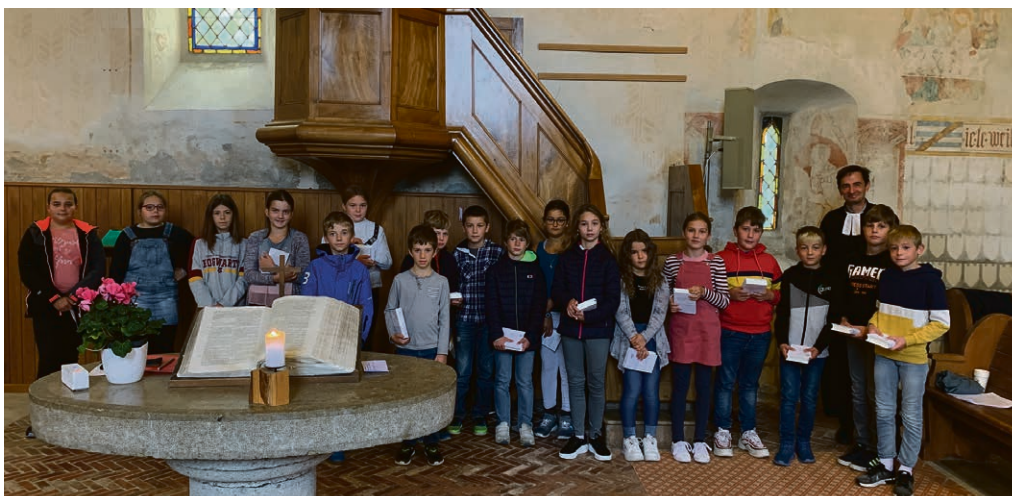
Les KT 7 (volée 2020-2021) viennent de recevoir leur bible.