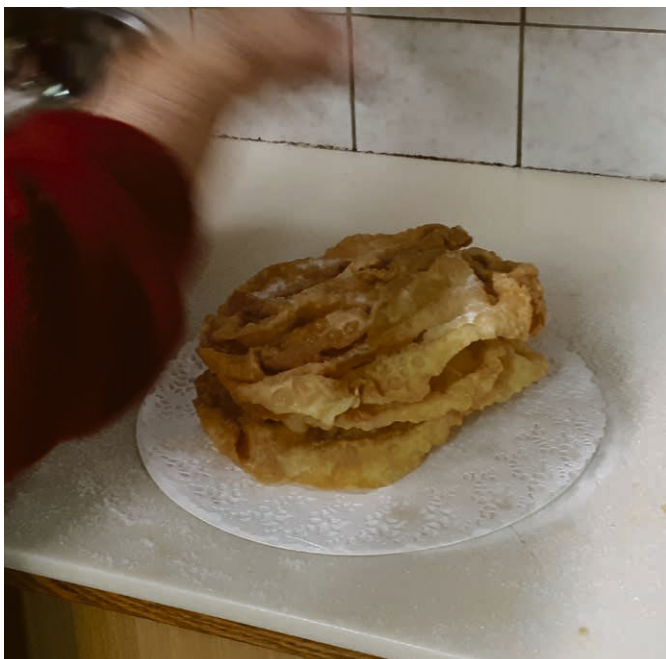
Les merveilles de la fête de paroisse du plateau du Jorat.

Indiquez le nom et prénom de votre enfant, adresse, date de naissance, année scolaire (si déjà scolarisé), nattel de l'un des parents, adresse e-mail de l'un des parents. Toute l'équipe se réjouit d'ores et déjà de vous rencontrer afin de partager ces moments de grandes émotions.