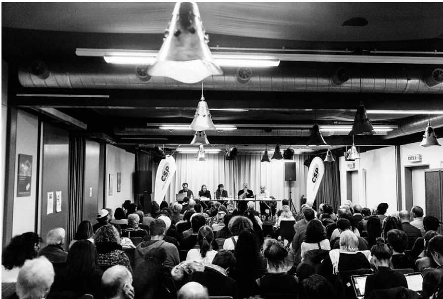
Réunion sur le sujet des sans-papiers en novembre 2018 à l'assemblée générale du CSP Vaud.

Le programme genevois qui a permis une régularisation inédite de personnes sans-papiers pourrait être repris dans d'autres cantons.