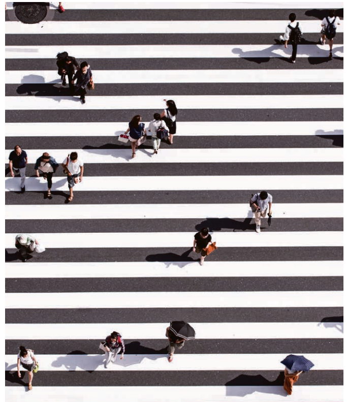
Culte du souvenir à Pailly: une attention à ceux qui ont traversé une étape difficile.

Les mercredis soir, à 20h15 , au collège d'Essertines: 6 novembre, 4 décembre, 8 janvier, 5 février, 4 mars, 1 er avril.