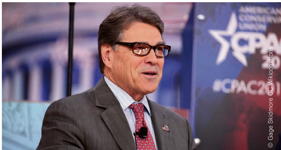
Rick Perry à la Conservative Political Action Conference de 2018.

Parmi les soutiens farouches au climatocéptique Donald Trump, une majorité chrétienne conservatrice, dont des évangéliques. En Suisse romande, leur discours ne passe pas. Au contraire.