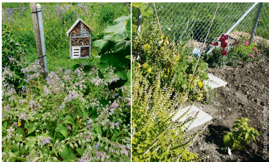
La parcelle du jardin de la paroisse de l'Espace Saint-Luc à Genève.