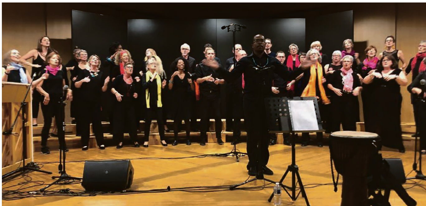
Le chœur Gospel for All.

Les cultes des dimanches 3, 10 et 17 novembre seront diffusés en direct sur Espace 2 depuis le temple d'Echallens, avec un nombre d'auditeurs oscillant entre 6000 et 10 000 personnes.