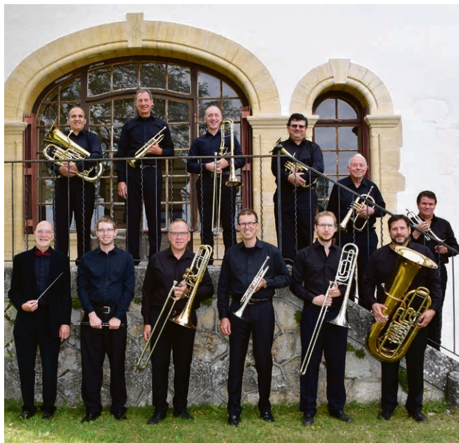
Dix de cuivre: le 10 novembre à 17 heures à l'église de Goumoens-la-Ville.