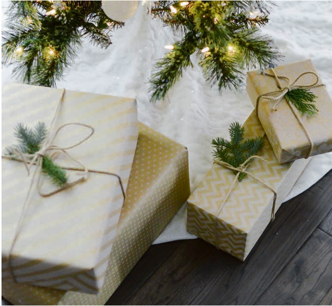
Notre paroisse du Sauteruz, solidaire pour des familles défavorisées.

défavorisées. Cette année, nous allons proposer cette action au niveau de la paroisse, durant la semaine du 18 au 22 novembre . Vous pouvez apporter des articles à offrir, aider à remplir et emballer les paquets, faire un don pour permettre l'achat des articles. Renseignements : dorothee@bornick.ch ou 078 880 87 27.