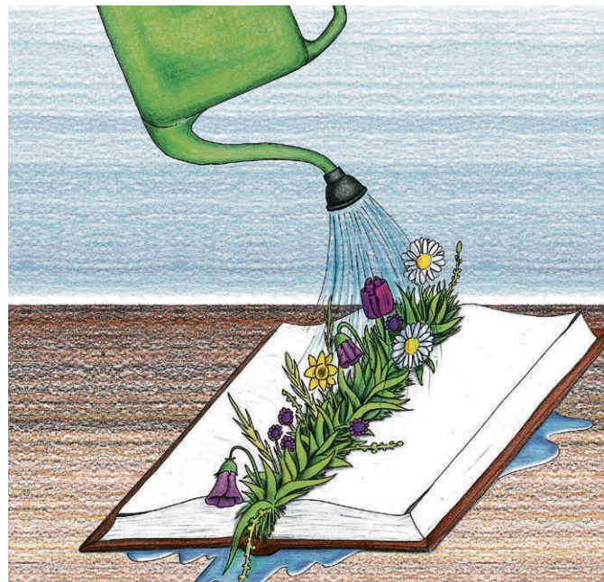
La Sarraz: Quelle joie de pouvoir éveiller les petits enfants à la foi.