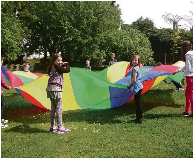
Une paroisse haute en couleur.