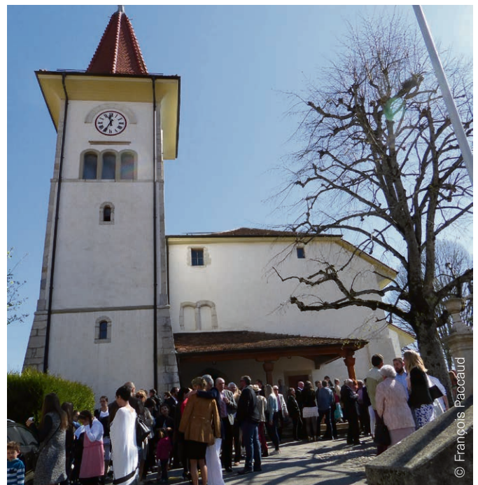
Gimel - Longirod Culte des Rameaux 2017, sur le parvis de l'église de Gimel.