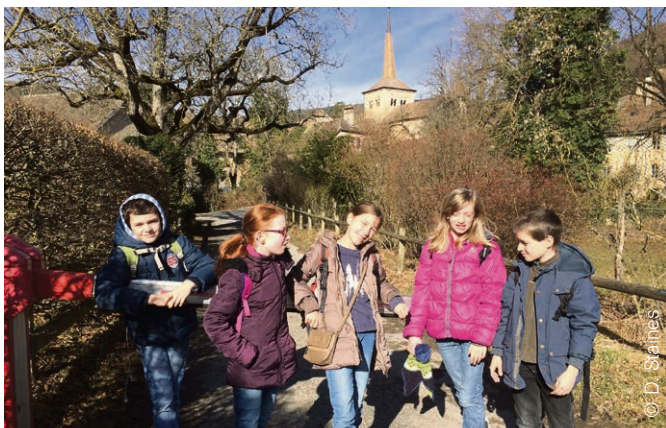
Morges - Echichens Quelques catéchumènes de notre paroisse en chemin vers Romainmôtier.