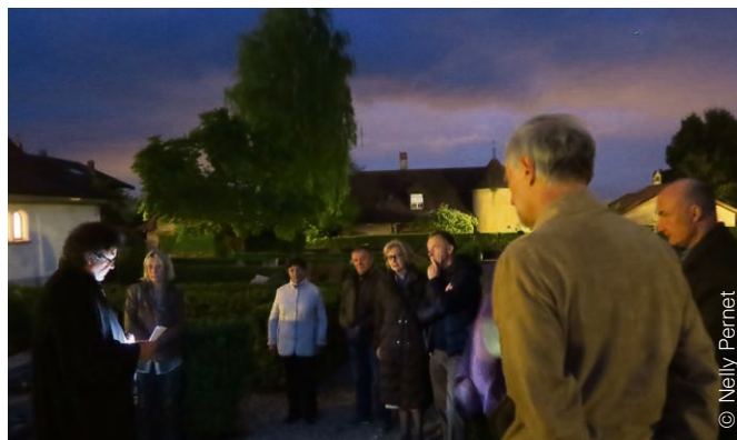
L'Aubonne Veillée pascale à la chapelle de Buchillon.