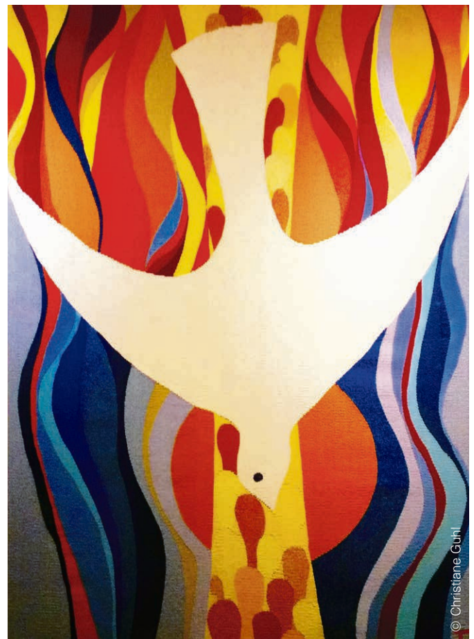
Pied du Jura Tapisserie murale du temple d'Apples.

PIED DU JURA Dimanche 18 juin, 10h , cabane des bois de Ban: à la sortie de Ballens en direction d'Aubonne, suivre la route à droite après le stand de tir. Culte en plein air, soutenu par le Chœur paroissial. L'équipe Terre Nouvelle vous attend avec un feu, des boissons et des salades. Apportez vos couverts, viande, pain, fromage, etc... Une belle journée à vivre en communion avec la paroisse de Bodvaszilas que nous parrainons.