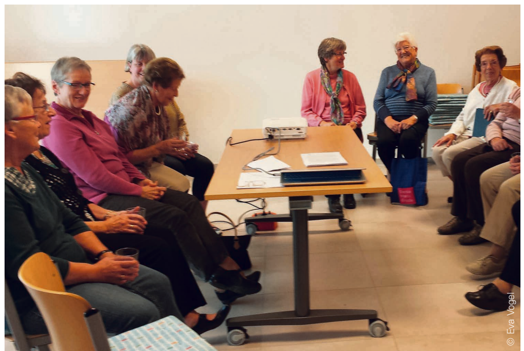
Kirchgemeinde Morges - La Côte - Nyon Groupe de formation d'adultes sur les rêves.

Dimanche de Pentecôte, le 4 juin à 14h et à 17h , dans le cadre des caves ouvertes vaudoises et de la Cuvée de la Réforme, au Domaine Blanchard, Grand Rue 23 à Bougy-Villars, vous pouvez expérimenter l'association harmonieuse ou non de vins avec des nourritures simples, fromages, viandes,