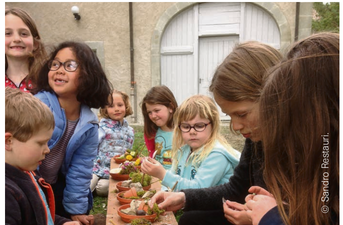
Saint-Prex - Lussy - Vufflens Journée culte de l'enfance du 1 er avril.

Le 20 juin, à 12h , à Vufflens, repas EPP, inscription au 021 331 56 77.