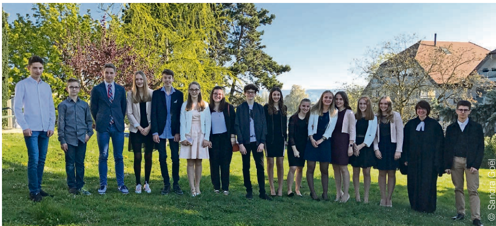
Lonay - Préverenges - Vullierens 15 jeunes nous ont fait vivre un culte des Rameaux riche et émouvant.